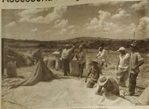
Colheita de arroz na lavoura comunitária.

Durante o ano de 2006, a assessoria de Agricultura e Meio Ambiente de Ceres, órgão ligado à Prefeitura Municipal, executou diversos e importantes trabalhos na área levando a