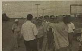
Os moradores, vítimas de acidentes e parentes de vítimas fatais cobram uma atitude urgente das autoridades para resolver o problema.

A assessoria de imprensa da AGETOP informou que nos próximos dias equipes de engenharia de trânsito vão analisar quais deverão ser as