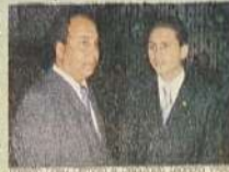
Prefeito Lineu Olimpio e deputado Leandro Vilela no Sítio Maria durante posse no dia 1º de fevereiro.

O prefeito de Jaraguá Lineu Olimpio prestigiou em Brasília no último dia 1º de fevereiro a posse do Deputado Federal Leandro Vilela (PMDB). O prefeito apoiou o deputado na última eleição, dando a ele uma expressiva votação em Jaraguá. Mesmo antes da campanha Leandro Vilela já vinha ajudando a município, como na emenda parlamentar que garantiu recursos para canalização de parte do Córrego Rio Vermelho.