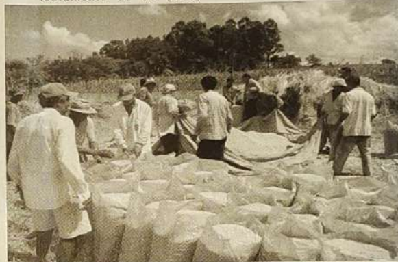
Em 2006 a lavoura comunitária rendeu 1300 sacos de milho e aproximadamente 1500 sacos de arroz.

Objetivos para 2007: Criar o Conselho de Meio Ambiente e o Fundo do Meio Ambiente que permitirá a captação de recursos e possibilitará consequentemente, maiores investimentos na área ambiental.