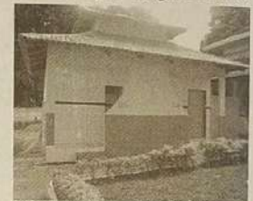
Construção de banheiros na Praça Central com modernas instalações.