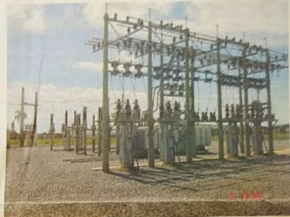
A SE conta com abertura em três alimentadores de 13,8 KV