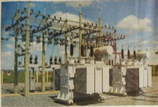
S.E. do Jardim Paulista

Com investimentos de grande valor, a Companhia Hidroelétrica São Patrício CHESP, participa de maneira significativa do desenvolvimento regional no Vale do São Patrício. O município de Nova Glória é exemplo disso, já que foi instalada no bairro