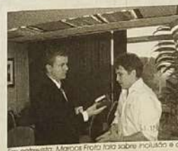
Em entrevista, Marcos Frota fala sobre inclusão e o preconceito.

de deficiência, esse espetáculo tem uma grande mensagem, que é: "O deficiente que não se expõe, não se empoe".