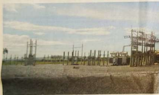
Vista Parcial da S.E.

contribuir com o seu desenvolvimento, e a Companhia Hidroelétrica São Patrício CHESP tem orgulho em fazer parte do progresso de Nova Glória, trazendo a energia que fomenta seu crescimento, gera empregos e consolida seus ideais".