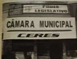
A cassação dos vereadores e um ato político no poder legislativo.