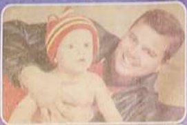
Leonardo filho com seu pai Leonardo. Amor incondicional