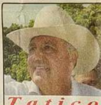
Tatico Deputado federal por Goiás. [12]