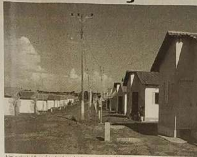
Na administração de Jacob, foram construídas mais de 100 casas populares.

ruas, conservação de estradas. "Inauguramos do outro lado do rio, duas pontes de concreto, pontes de 7 metros de extensão, uma estrada que liga Lavrinha a Porto Leocardio, com mataburro, ponte e toda estrutura. Vamos estar preparando para o próximo mês, fazer com que todas as casas de São Luiz e povoados com exceção da Zona Rural que não vai ser completada ainda 100% mais terão o módulo sanitário de forma que aquela casa, aquela residência que ainda não tem banheiro, vai passar a ter um módulo sanitário, vão ser cerca de 90 unidades e assim estaremos completando o cerco, mais de 300 banheirinhos, já construídos na nossa administração e vamos estar nesses próximos meses, se Deus quiser, dando início a ampliação do Posto de Saúde Central, que vai ficar muito bonito e estará atendendo bem a cidade pelos próximos 10, 15 anos. Estarei iniciando a construção do Lago, que é o sonho de toda população, então se Deus quiser nos