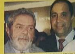
Presidente Lula e o prefeito Lineu Olimpio durante assinatura de um convênio.

campanha do presidente Luis Inácio Lula da S