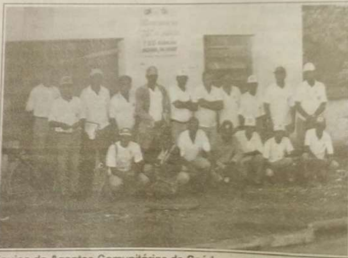
Equipe de Agentes Comunitários de Saúde, que atuam em Jaraguá e município

* Monte Castelo 2 focos * Artulândia - 5 focos