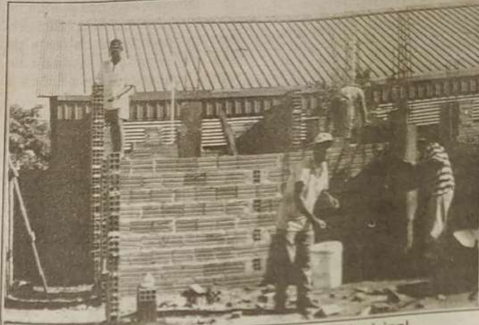
Vista da construção do Ambulatório do Hospital Municipal

De acordo com o secretário, buscamos direcionar nosso