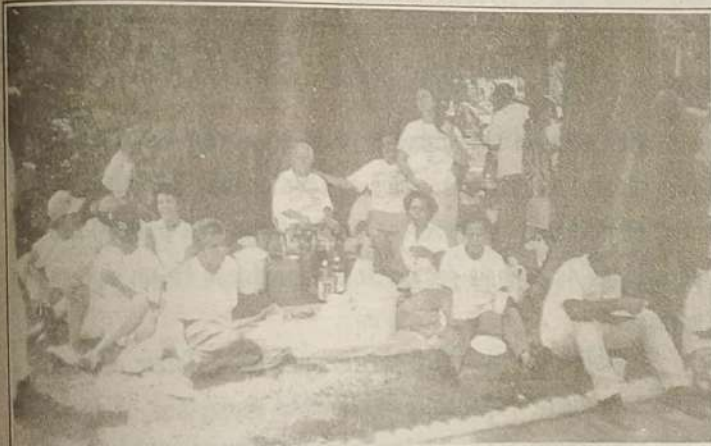
Passeio de confraternização promovido pela Fundação Grace Machado com os moradores da Casa do Idoso, no clube Ferreira Pacheco em Goiânia.