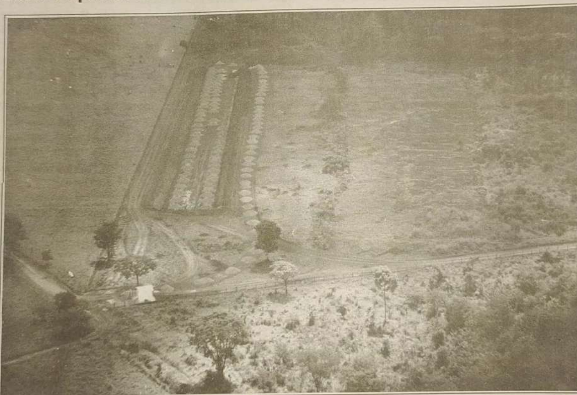
Vista aérea do Aterro Sanitário de Jaraguá

A PREFEITURA MUNICIPAL IRÁ DISTRIBUIR UMA PROGRAMAÇÃO DE COLETA DE LIXO. AGUARDEM!