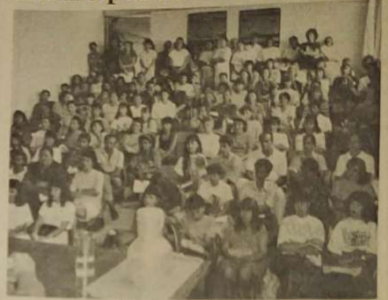
Professores da rede municipal