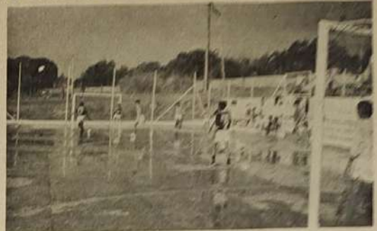
Disputa esportiva na quadra de esportes da Vila São José.

Com a certeza de estarmos juntos para celebrarmos o