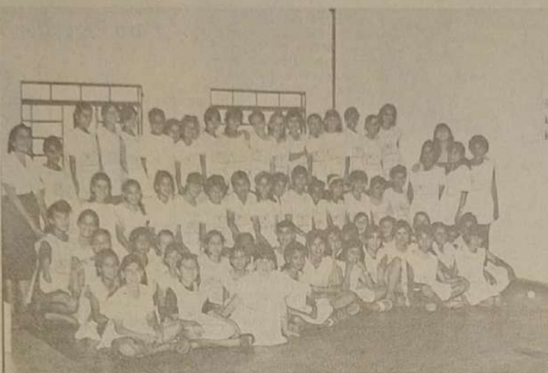
Ama - Apoio as menores artesãs.

Iniciado na administração do Prefeito Paulo Antônio, este projeto teve início com o Clube do Pequeno Trabalhador. Onde crianças de ambos os sexos, trabalhavam nas ruas, fazendo pequenos serviços (vendendo salgados, picolé, etc.). Houve a necessidade de separar meninos e meninas, dando-lhes uma orientação mais direcionada. Aos meninos foram doados caixas de engraxate, para as meninas criaram o "AMA", onde elas passariam a ter uma assistência maior, que foi de higiene pessoal, até afazeres domésticos. Mas o intuito maior era dar a estas meninas, uma preparação para o mercado de trabalho. São noções básicas para o comércio, ensinamentos na arte do Crochê, Triô, Bordado, Confeção de Flores, etc. A produção alcançada é colocada a ven-