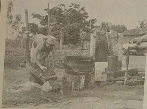
Antes a Dificuldade

Participe dos festejos dos 110 Anos de Jaraguá. Você é quem mais merece essa festa. DE 25 A 29 DE JULHO DE 1992. Shows, Rodeios e outras atrações artísticas.